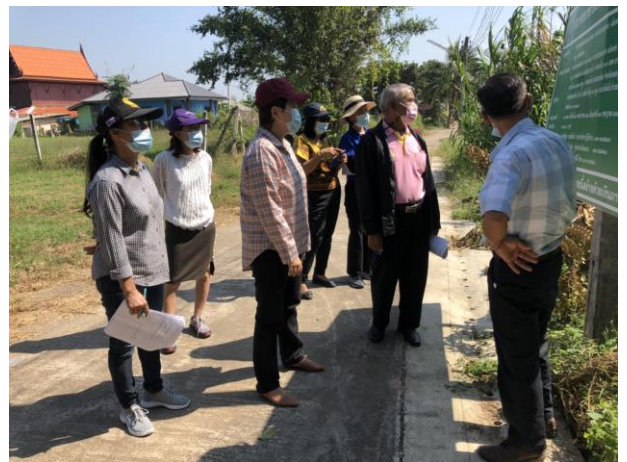
ก่อสร้างท่อเหลี่ยมระบายน้ำ คสล. จากบ้านนายประมวด แยม พงษ์ ถึงถนนเลียบบคลองชลประทาน (บ้านพร้อมใจ) หมู่ ๒ ตำบลสระพัง