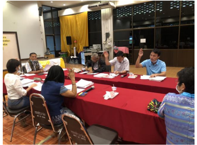
ก่อสร้างอาคารเอนกประสงค์บ้านท่าหอย หมู่ ๓ ตำบลทับ