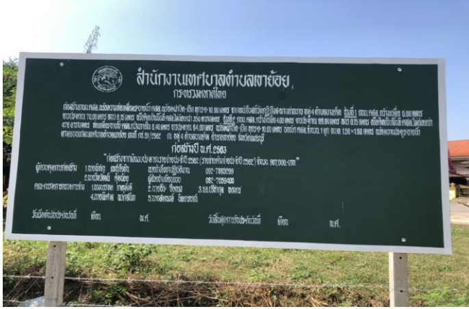
ก่อสร้างถนน คสล. พร้อมวางท่อเหลี่ยมระบายน้ำ คสล. พร้อมฝาปิด - เปิด ทุกระยะ ๑๐.๐๐ เมตร จากหน้าโบลด์ วัดกุฎี ถึงสะพาน ท่าทราย หมู่ ๔ ตำบลบางเค็ม